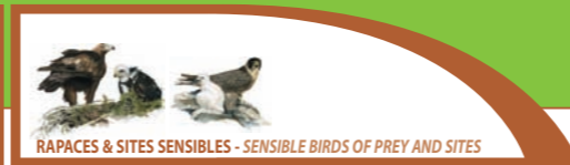
RAPACES & SITES SENSIBLES - SENSIBLE BIRDS OF PREY AND SITES

8- Décollage SEMNOZ-CÔTÉ VIUZ LA CHIÉSAZ (take off) Orientation : O - GPs: 45° 48' 17" N - 6° 5' 41" E - Altitude : 1480 m Accès : Monter au Semnoz. Se garer au parking. Décollage derrière les bâtiments, 2 min de marche. Observations : Panorama magnifique. Décollage faïsalé. Facile par vent d'O. Rouleaux par vent de N. Bus : Depuis Anney - Ligne été - http://www.sibra.fr Ligne hiver Altibus - http://www.voyages-colard.com Directions : Go up to the Semnoz ski resort. Park on the car park. Taking off site is behind the buildings (2 mins walk). Observations : Outstanding views. Easy cliff take off with West winds. Rotors with North wind.