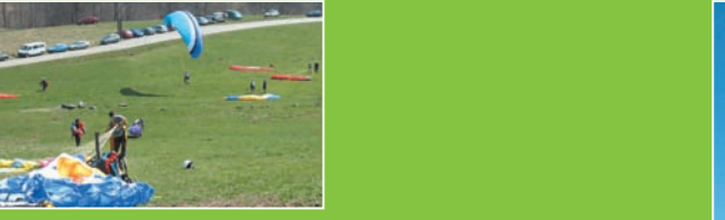
RAPACES & SITES SENSIBLES - SENSIBLE BIRDS OF PREY AND SITES

1- Atterrissage LES LÈS (landing) Orientation : Sud-Ouest, Nord-Est - GPs: 45° 32' 41" N - 06° 07' 23" E - Altitude : 270 m Accès : Sur la D1006 (N6), prendre direction St-Jean-de-la-Porte sur 1 km. Prendre le chemin à gauche, prendre la droite après le pont (canal). Au bout de 750 m, passer le pont à gauche et tourner à droite jusqu'au parking, sous les arbres. Atterrissage à 100 m. Observations : Favorable sans vent ou par légère brise de vallée (forêt après-midi et possibilité de thermiques sur le terrain). Ligne OF et voie ferrée en approche. Règlementation : Hors-terrains interdits en raison des cultures (vignes rampantes, bourgaches)... Prise de terrain obligatoirement en PTU. Directions : On the D1006 (N6), take left in direction of St-Jean de la Porte for 1 km. Take the track on the left just after the irrigation canal. Follow it for 750m, go past the bridge, turn right and go up to the car park under the trees. The landing zone is a 100m further on. Flying conditions : Favorable without wind - a fair valley breeze to strong valley breeze and thermal on the grounds are possible in the afternoon. Electric cables and railway tracks nearby. Regulations : Everything off-grounds is strictly forbidden due to vine yard culture - Please respect the sense of landing PTU.